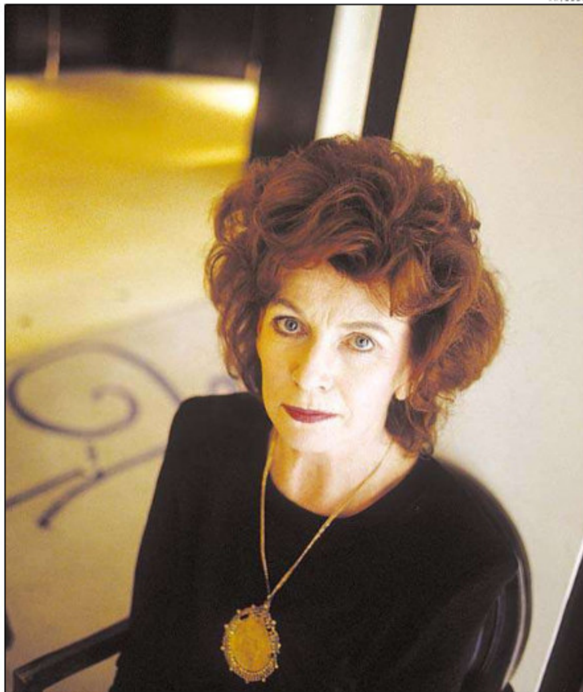
EDNA O'BRIEN: "O que amamos num romance, num conto, é a interação e o conflito entre seres humanos"

EDNA: Meu livro não era especificamente sobre o casamento de Joyce, embora sua companheira Nora Barnacle tenha sido crucial na vida dele. Meu maior interesse era Joyce como um escritor, pois ele é muito importante para um mundo de escritores, e mais especificamente para escritores irlandeses. Ele está no topo da montanha, e outros o seguem, motivados por sua linguagem. Foi como disse no meu livro