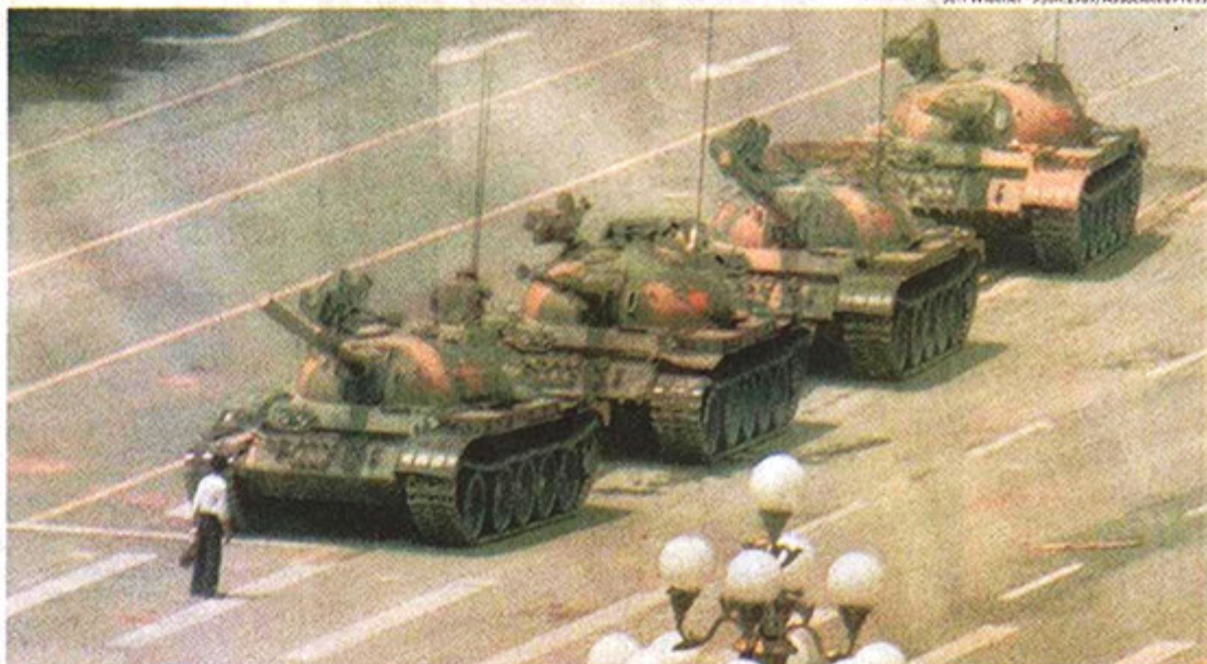
Homem bloqueia passagem de tanque, em imagem símbolo do protesto pró-democracia da praça da Paz Celestial, em junho de 89

Há pouca curiosidade sobre o Ocidente. Eles engoliram a propaganda do governo de que o Ocidente é inimigo da China, querendo impedi-la de virar superpotência. Perderam a habilidade de fazer perguntas, assim como o desejo de fazê-las.