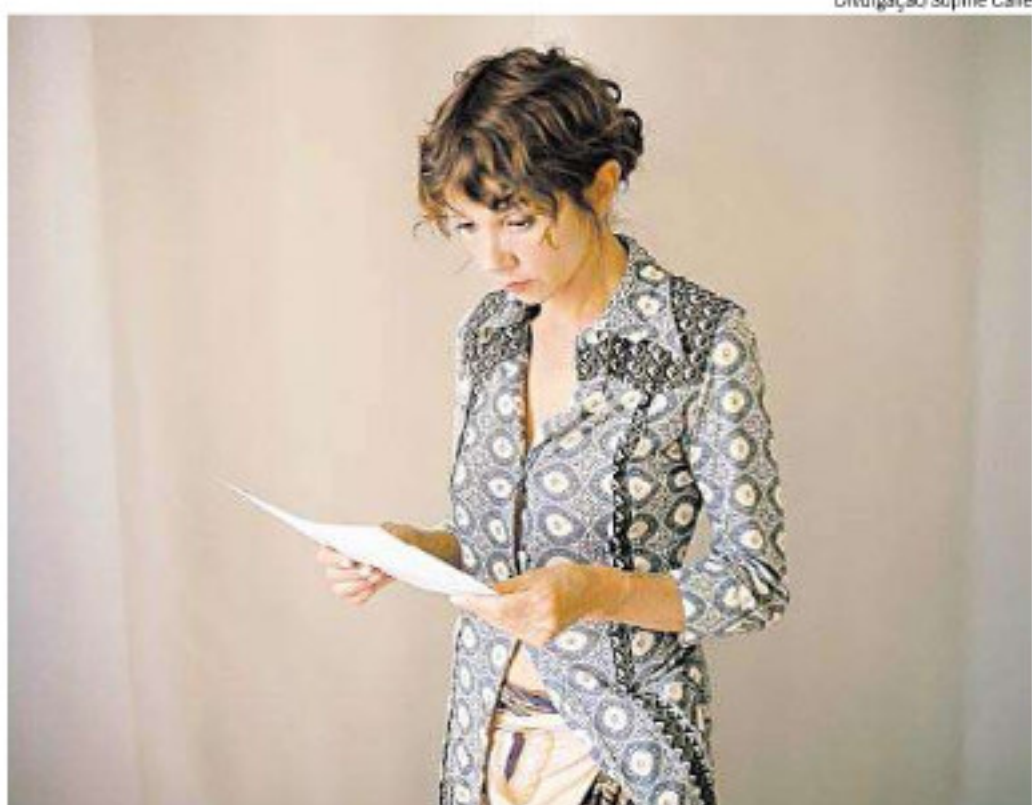
A ATRIZ espanhola Victoria Abril interpreta o e-mail no qual o namorado de Sophie Calle termina o relacionamento: exposição será realizada em São Paulo e Salvador