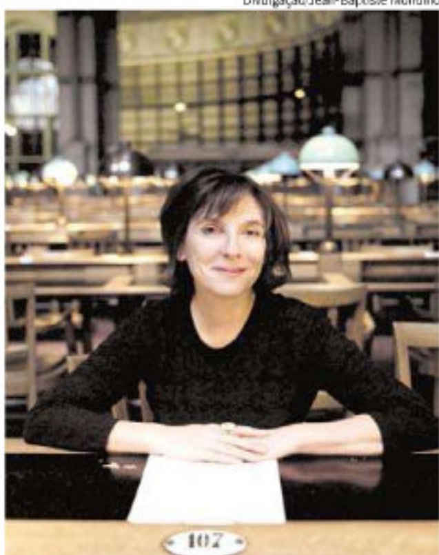
SOPHIE CALLE na Biblioteca Nacional de Paris, na exposição "Cuide de você"