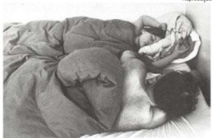
UMA DAS FOTOS de corvidados a dormir na cama de Sophie Calle

olho pessoal e impessoal, quase completamente voyeur e quase verdadeiramente imerso na cena". Sophie e o então namorado, o fotógrafo Greg Shephard, filmaram e editaram juntos uma viagem pelos Estados Unidos, que culminou num inusitado casamento em Las Vegas. O filme mostra o abismo entre os dois: "Ele olha seu carro como se fosse para a esposa parindo", diz Sophie em certo momento.